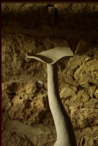
LE TERTRE AUX FUSEAUX 22170 BOQUEHO

- Audrey Kimmel est installée dans son atelier en Bretagne et expose ses graines germées. Contact@audreykimmel.com 02 96 42 16 90 ou 06 25 70 05 16